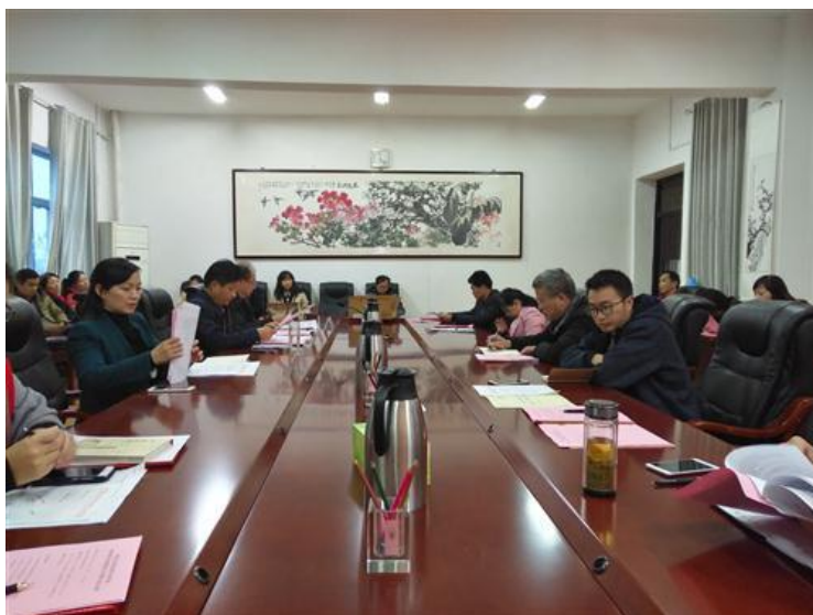
教学督导员聘任会议

学校重视从人才培养方案制定、教师教学、实践实训到毕业设计整个人才培养过程的监控与管理。制定了《阜阳幼儿师范高等专科学校学生综合测评实施办法(修订)》，制定了《阜阳幼儿师范高等专科学校教学督导工作实施办法》等文件，成立教学督导组。为了预防教学过程环节可能出现的质量漏洞，学校重点加强了对教师备课、讲课、辅导、作业布置与批改、考试、实习实训等教学环节的监控。