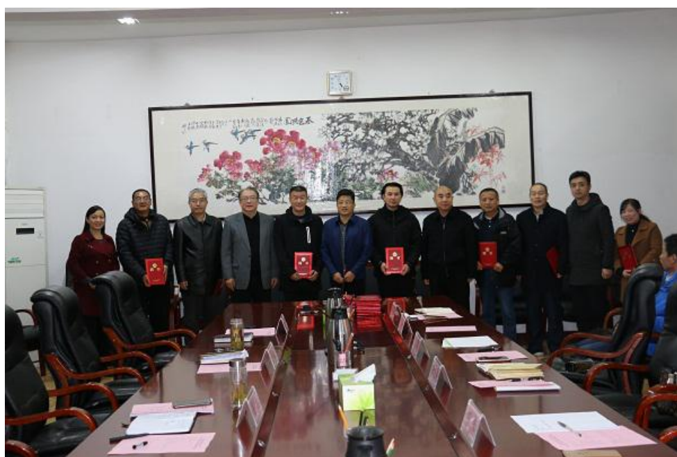
教学名师和专业带头人聘任会议

学校重视引进先进的教学理论、经验和方法，每年都挑选部分学术水平高、专业教学能力强的教师作为专业带头人的候选人到重点高校考察和培训学习，开阔视野，吸收专业前沿理论和方法，提高综合素养。2017-2018 学年，我校共选送约 71 名教学经验丰富、专业过硬的教师外出考察和学习。积极聘请企业（或幼儿园）中高级以上专业人员到学校执教，弥补我校理实课程教师资源的不足，丰富了学校教研活动内容，增加了教研的深度，增强了理论教学的实践性，让学生所学知识与实践更接近了。